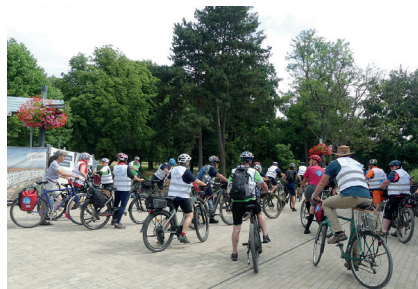
Start zur nächsten Etappe