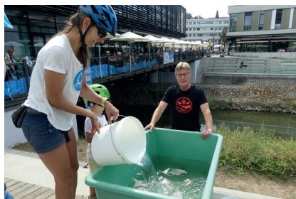
Wasserübergabe an der Bibliotheksbrücke in Bad Vilbel

Unter diesem Motto machten sich am 16. Juli viele Menschen zu Fuß und vor allem mit dem Rad von Frankfurt in den Vogelsberg auf. Beteiligt an der Aktion waren neben der Schutzgemeinschaft Vogelsberg (SGV), viele Kommunen des Wetterau- und des Vogelsbergkreises, Umwelt- und Naturschutzverbände wie der BUND, der Nabu, die SDW und die NaturFreunde Bad Vilbel, Vogelsberg sowie der Landesverband.