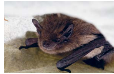
Bartfeldermaus, Foto: prilfish/ Flickr(CC BY-NC-ND 2.0)

den steilen Weg hinuntergehen. Hier begegnen wir Landart-Objekten des Warzenbeißer Kunstwegs. Im Tal nach rechts Richtung Banfetauch abbiegen. Nach ca. 400 m entlang der Banfetauch erblicken wir den Banfetauch. An dessen Ende links auf der Brücke über das Banfetauch gehen, dann gleich wieder rechts.