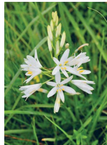
Astlose Graslilie, Foto: Apollonio Tottoli/Flickr(CC BY-NC-ND 2.0)

Aufgrund der unterschiedlichen Wasserstände des Edersees wechseln sich im Banfetrichter Trockenphasen und Überschwemmungen ab. An dem Schlammigen Flussufer mit Pioniervegetation wachsen seltene einjährige, an Überstauung angepasste Pflanzen wie der Gemeine Hirschsprung oder das Schlammkraut .