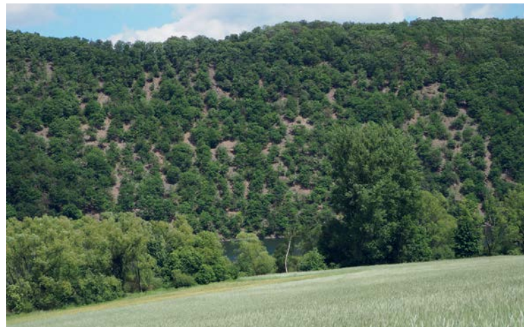
Blick auf die „Kahle Haardt“, Foto: Rainer Gilbert

Auf der „Kahlen Hardt“ führen verschiedene Wanderwege zu echten Urwaldrelikten mit teilweise bizarren Baumformen auf extremen Standorten. An den Steilhängen findet man warm-trockene Eichen-Fels- und Schuttwälder . Charakteristisch ist der relativ große Abstand zwischen den dort wachsenden uralten Trockeneichen und Mehlbeeren . Der Schieferboden begünstigt eine fast mediterrane Umgebung und bietet Lebensraum für seltene spezialisierte Flechten-, Käfer- und Insektenarten, z.B. den Veilchenblauen Wurzelhallschnellkäfer oder den Steppengrashüpfer . Gefährdet wird der Offenlandcharakter der Kieselhaltigen Schutthalden durch die Lupine , eine sich schnell ausbreitende, krautige Pflanze mit Wuchshöhe von bis zu 150 cm. Deshalb findet hier eine regelmäßige Entfernung statt. Zusammen mit Hainsimsen- und Waldmeister-Buchen- sowie Labkraut-Eichen-Hainbuchenwäldern ergibt sich ein Mosaik verschiedener Lebensräume als Grundlage besonderer Artenvielfalt.