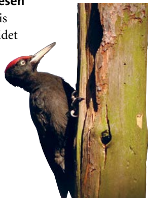
Schwarzspecht, Foto: Dryocopus martius/ Flickr(CC BY-NC-ND 2.0)

Kessbach und Banfe, einem mäandernden Bach mit flutenden Wasserpflanzen , in dem sich vor allem Bachforelle und die seltene Groppe heimisch fühlen. Man findet hier den Feuersalamander , aber auch seltene Schreckenarten wie die Kurzflügelige Schwertschrecke in Feuchtwiesen. Umsäumt wird die Banfe von einem urigen Bachauenwald , meist bestehend aus Erlen . Die Auenwälder bleiben der Sukzession überlassen, d.h. sie können sich hier durch natürliche Abläufe ohne Eingriffe des Menschen in ihren ursprünglichen Zustand zurückentwickeln.