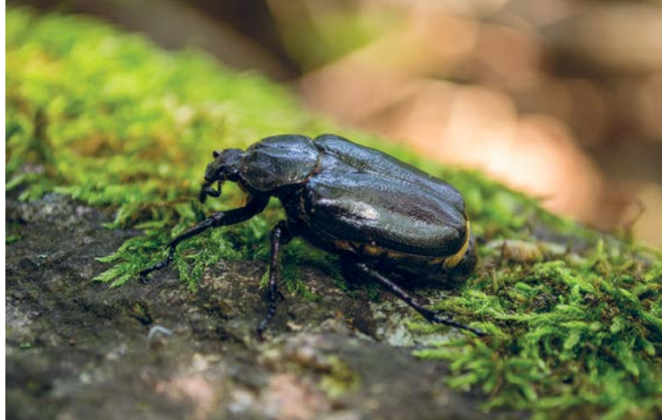
Eremit ( Osmoderma eremita )

Richtlinie. Silberweiden mit ihren knorrigen, oft hohlen Stämmen bieten hier Nist- und Zufluchtsstätten für viele Vogel- und Insektenarten. Auch findet man Kopfweiden – Weiden, deren Stämme als Jungbaum auf einer Höhe von etwa 1 bis 3 Metern gekürzt wurden und deren Zweige in der Folge regelmäßig beschnitten werden.