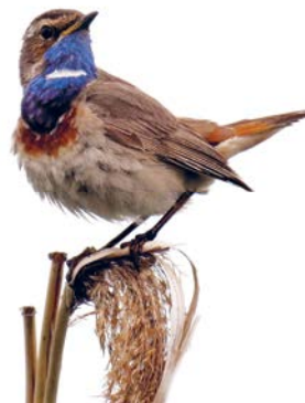
Blaukehlchen ( Luscinia svecica ), Foto: Corine Bliek/Flickr(CC BY-NC-ND 2.0)

Typische, gefährdete und daher geschützte Arten der Hartholzaue sind u. a. Käfer wie Eremit , Hirschkäfer und Heldbock .