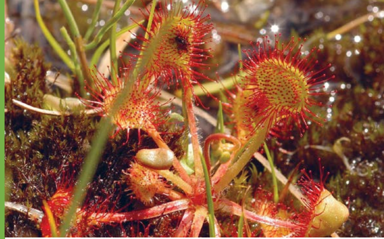
Rundblättriger Sonnentau

„Nur wo du zu Fuß warst, bist du auch wirklich gewesen.“ Johann Wolfgang von Goethe