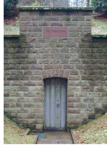
Gieserborn, Foto: Freak-Line-Community/wikimedia CC-BY-SA (3.0)

Auf dem Weg begegnen uns fünf von insgesamt zwölf 1875 erschlossenen Spessartquellen mit baulich interessanten Fassungen, die überwiegend aus flachen