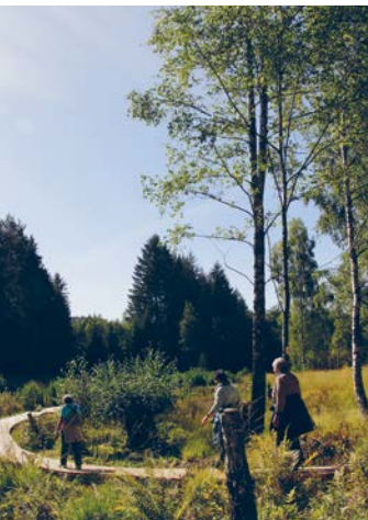
Heller Wiesenkнопfbläuling (links), Foto: Rolf Weyh Eschenkar (rechts), Foto: Gabi Herbert

Das Eschenkar am Lämmerbach war ein bäuerlich genutztes Wiesental, das nach Aufgabe der landwirtschaftlichen Nutzung mit Fichten aufgeforstet wurde. In den 1980er-Jahren wandelte man das mittlere Eschenkar in ein Feuchtgebiet um. Die nunmehr 60- bis