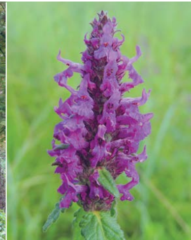
Echte Betonie, Foto: xulescu_g/Flickr(CC BY-NC-ND 2.0) (rechts) Fischteich, Foto: Vanessa Franz (unten)