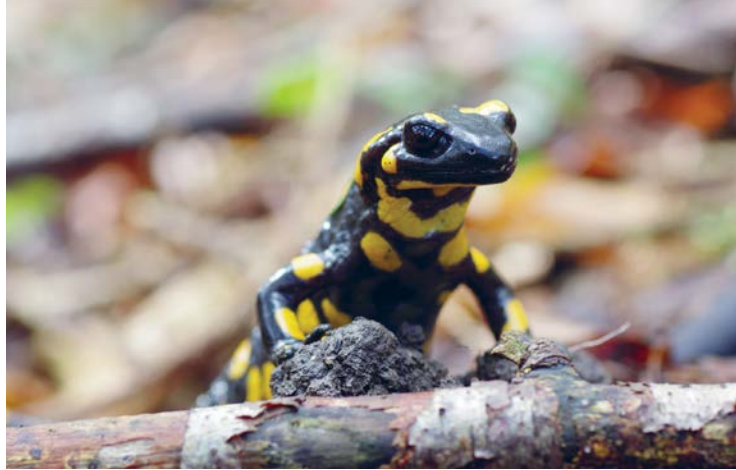
Feuersalamander (oben) Altholz (links)

Fachliche Unterstützung: Forstamt Wettenberg und Gemeinde Wettenberg