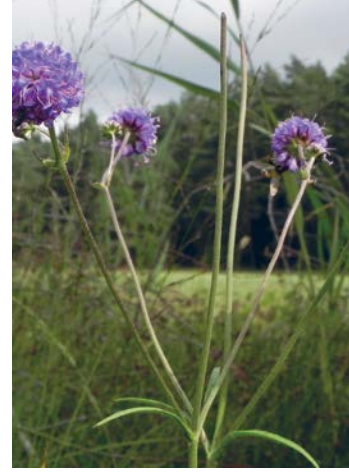
Teufelsabbiss, Foto: Hajotthu/ wikimedia/CC BY 3.0

Streuobstbäumen bewachsene Wiese mittelalterlichen Ursprungs, die inzwischen der Heugewinnung dient. Die extensive landwirtschaftliche Nutzung, also Mahd nach bestimmten Vorgaben und der Verzicht auf Dünger, lässt auf dem nährstoffarmen und wasserreichen Boden Pfeifengraswiesen wachsen. Zusammen mit den eher in Richtung Wißmarbach befindlichen Feuchtbrachen entsteht durch dieses Nebeneinander unterschiedlicher Biotoptypen eine hohe, insbesondere pflanzliche Artenvielfalt. Erwähnenswert ist das Vorkommen ausdauernder krautiger Arten wie der Echten Betonie , der Kümmelblättrigen Silge und des Gewöhnlichen Teufelsabbiss . Ohne Mahd und Entbuschung würden die Wiesen rasch verschwinden. Schwarzdorn und Brombeere breiteten sich aus. Arten, die auf den Offenlandcharakter angewiesen sind, würden verdrängt. Langfristig würde aus den Wiesen wieder Wald werden.