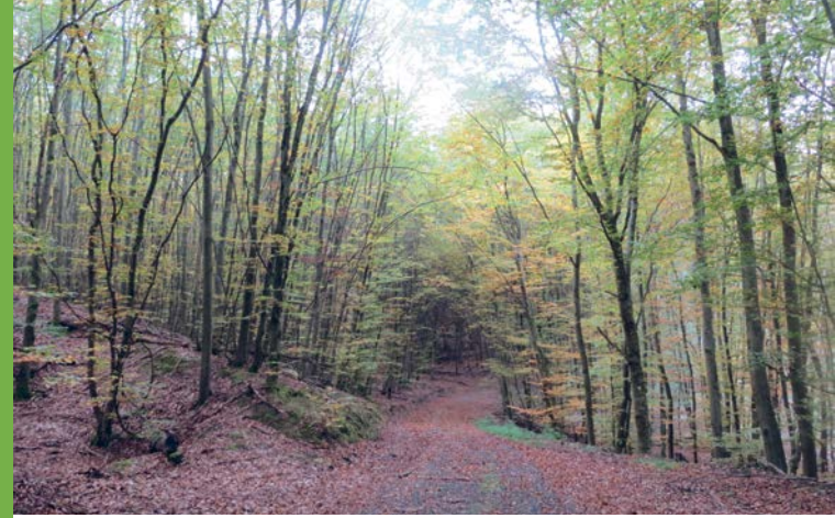
Hainsimsen-Buchenwald